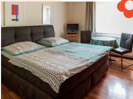
Eins unserer Doppelzimmer

Unser schöner, ruhiger Garten hinter dem Haus kann zum Entspannen genutzt werden.